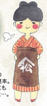
おふとんのカバー柄見本。このほかにもいろいろと…