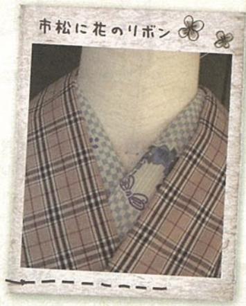
市松に花のリボン